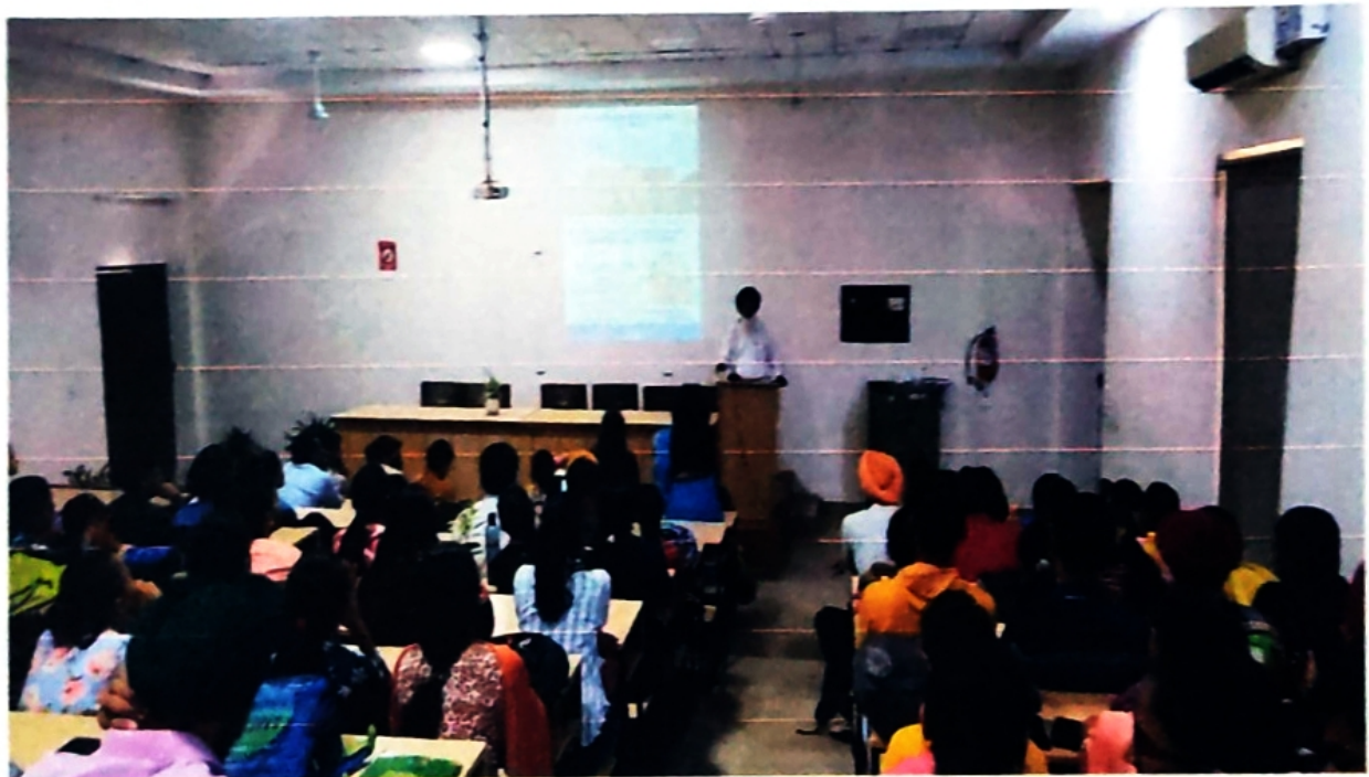
Seminar on 'How to crack GATE Exam' Conducted by Finishing School