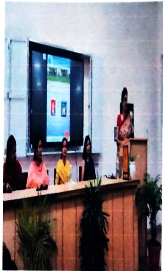
Workshop on Enhancing Employability Skills by Finishing School