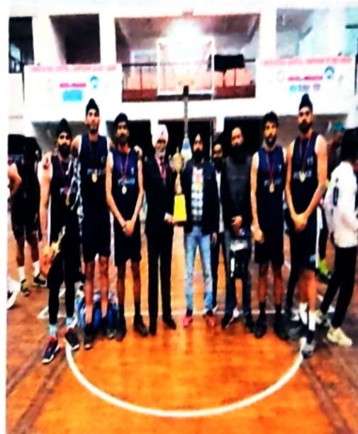
Champions in Inter College Tournament