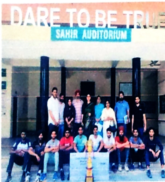
Second in Volley Ball Championship