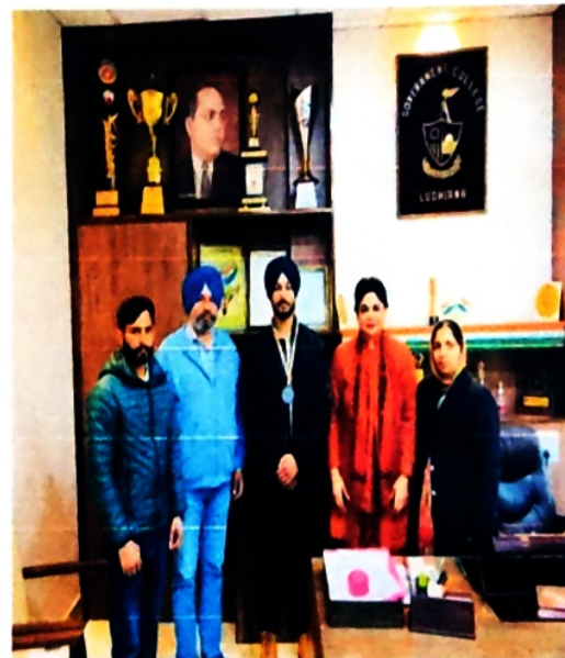
Bronze in Skating Tournament