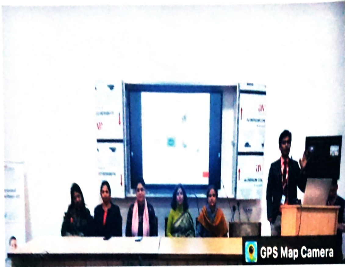
Seminar on Job Opportunities in the different Sectors