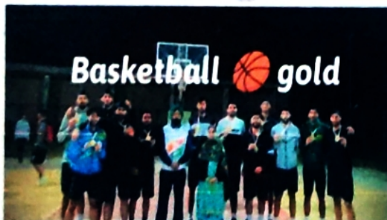
Silver Medal in Volley Ball