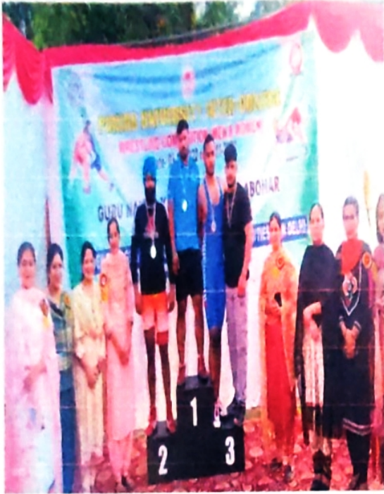
Bronze in Weight Lifting Competition