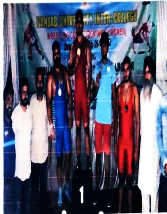
Gold in Wrestling Tournament